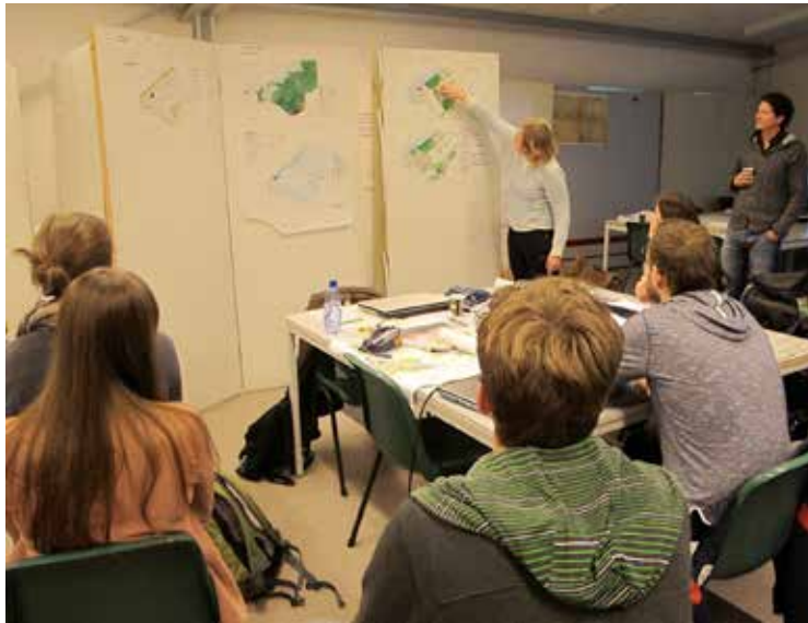
Impressie ontwerppraciticum VHL met de Natuurlijke Alliantie