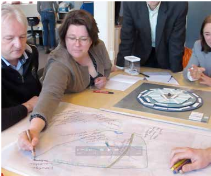
Impressie van werksessie tijdens pilot Ruimte en Gezondheid in Apeldoorn