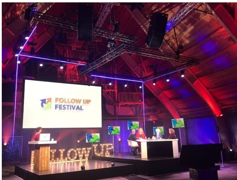
Follow Up Festival

Helaas konden veel fysieke bijeenkomsten dit jaar niet doorgaan, maar daar zijn gelukkig andere vormen voor gevonden, eindigend in het Follow UP Festival ('Samenwerken geeft veerkracht aan de bodem') eind november. Verder hebben we een infographic gemaakt met alle communicatielijnen, om mee te geven aan de Werkgroep Afspraken. We hebben artikelen 'buiten de bodem' georganiseerd, zoals in vakbladen EnergiePlus en Rooilijn. En we maakten, als klap op de vuurpijl, twee prachtige e-magazines die de resultaten van het UP helder belichtten. Daarnaast is een online bibliotheek geopend waar alle projecten en producten van het UP op gestructureerde wijze zijn opgeslagen.